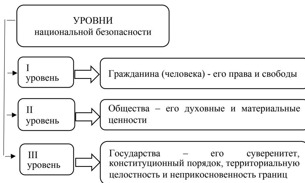
2 рис. Уровни национальной безопасности

Исходя из этого, выделяют три уровня основных объектов безопасности (рис. 2).